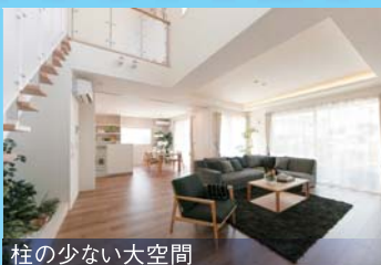
柱の少ない大空間

388項目※の緻密な構造計算で 耐震性・耐久性をシミュレーション ※多雪区域は440項目。