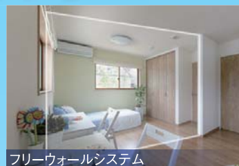
フリーウォールシステム